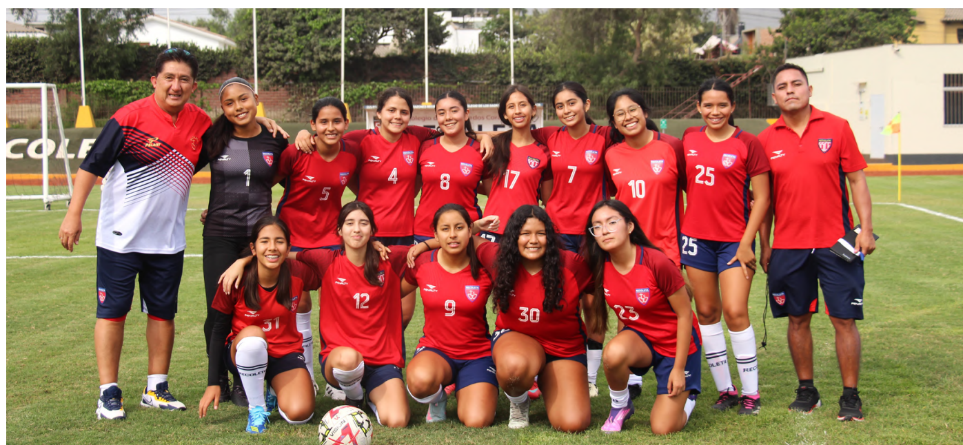
SELECCIÓN DE FÚTBOL DAMAS MAYORES - ADECORE 2026