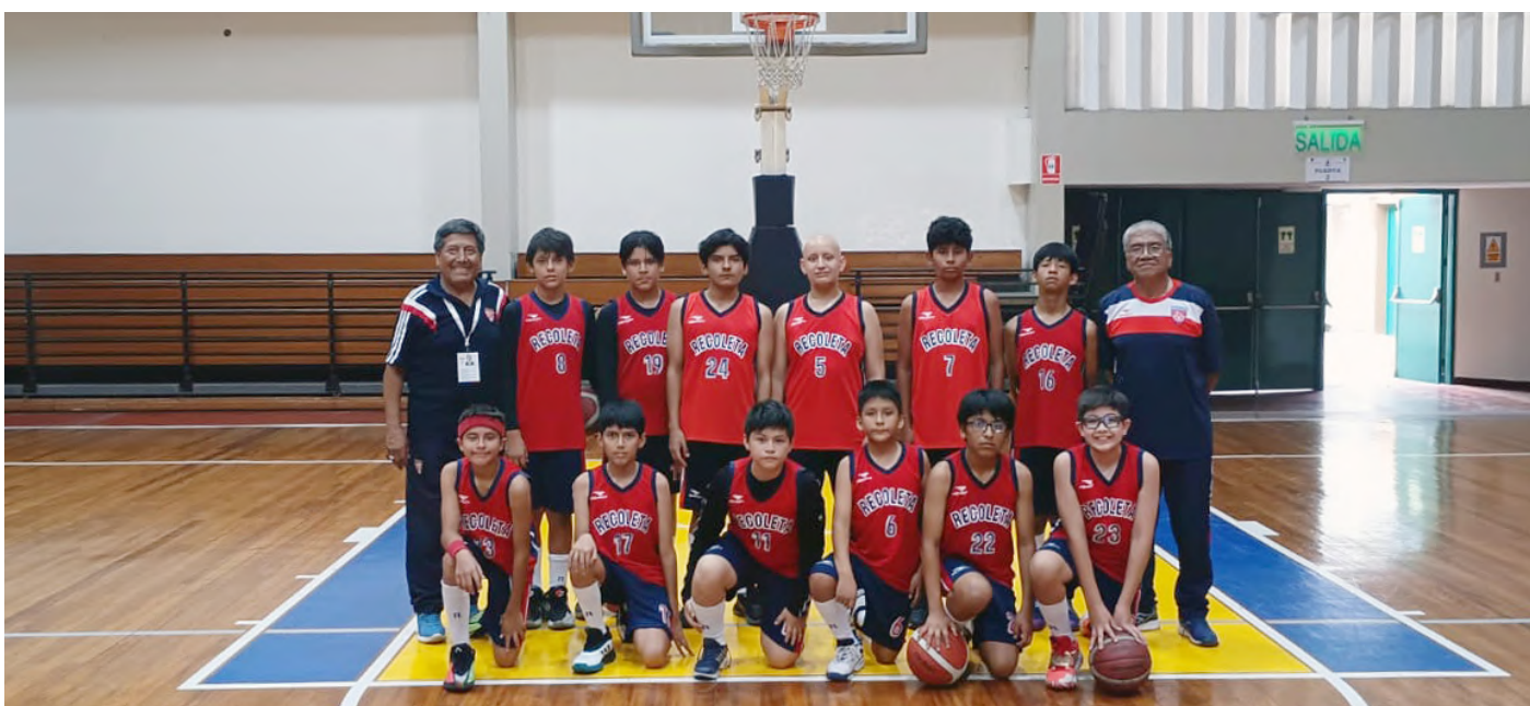
SELECCIÓN DE BÁSQUET VARONES MENORES - ADECORE 2026