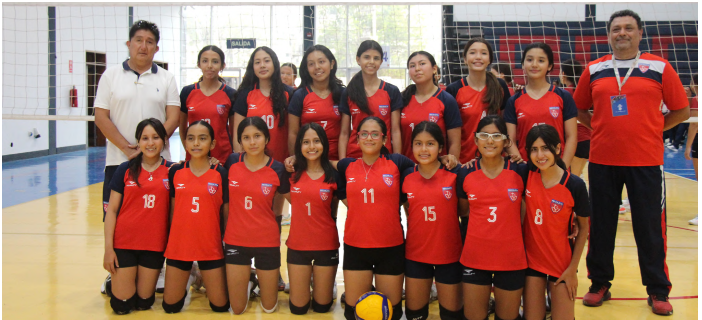
SELECCIÓN DE VÓLEY DAMAS MEDIANAS - ADECORE 2026